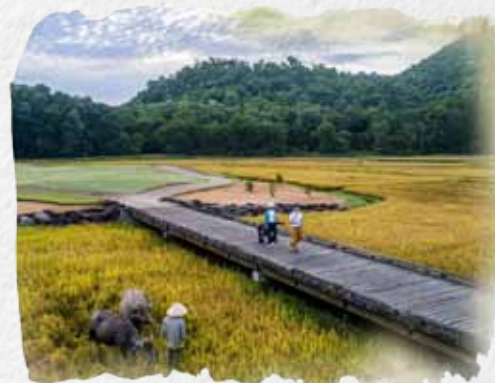
环境修复后的邦涛湾

2017年，我们将兰珂高尔夫球场附近荒芜的稻田扩展并重新开垦。2018年，我们耕种了四公顷的土地，使用水牛犁田，稻米产量达14吨，超过2017年的9吨。